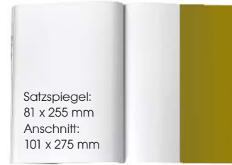
1/2 SEITE HOCH