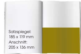
1/2 SEITE QUER