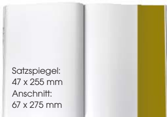
1/3 SEITE HOCH