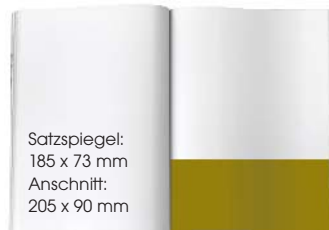
1/3 SEITE QUER